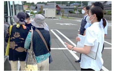
買い物ツアーの様子

「自分で買い物に行けない…」等のニーズに対応するため、令和4年9月7日(水)おもだかくらぶ「地域交流お買い物ツアー」を企画・開催しました。今回の買い物ツアーは、坂元周辺の住民の皆さま8名が参加し、和気あいあいと始まりました。行き先は、ヤマザワ角田店と道の駅かくだです。「重くて買えなかった小麦粉が買えた」「また開催してほしい」といった声に参加者の皆さまからあがっていました。あいにくの雨でしたが、たくさんの笑顔を見ることができた楽しい1日となりました。(高橋 談)